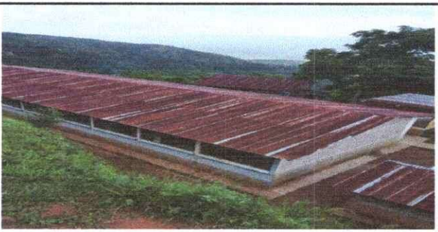
Foto 5: Se requiere pintar los muros del exterior e interior de la escuela.