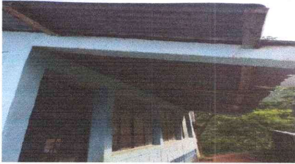
Foto1: Se visualiza sustitución de la cubierta de lámina ya que está dañanda y sustitución de madera por metal.